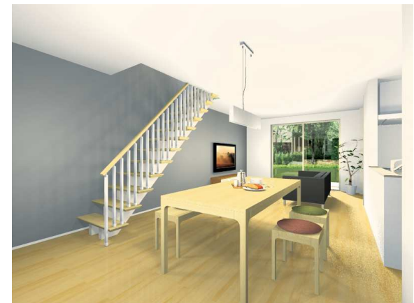
※イメージパースの外構、家具類、造付け家具は金額に含まれておりません。