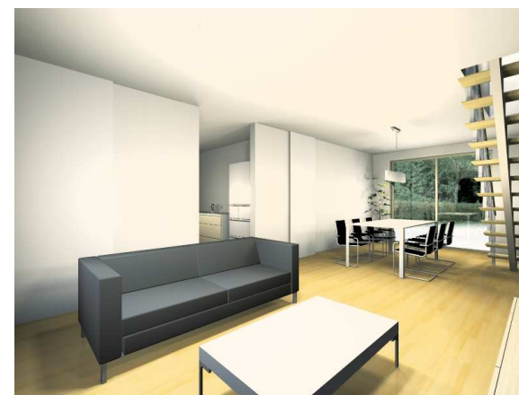
※イメージバースの外構、家具類、造付け家具は金額に含まれておりません。