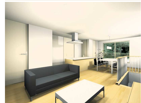
※イメージパースの外構、家具類、造付け家具は金額に含まれておりません。