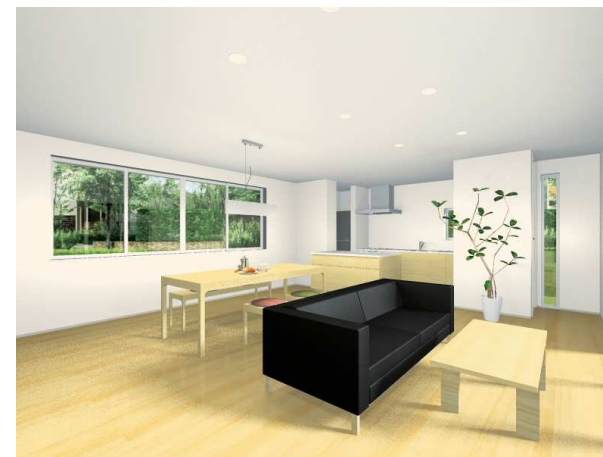
※イメージパースの外構、家具類、造付け家具は金額に含まれておりません。